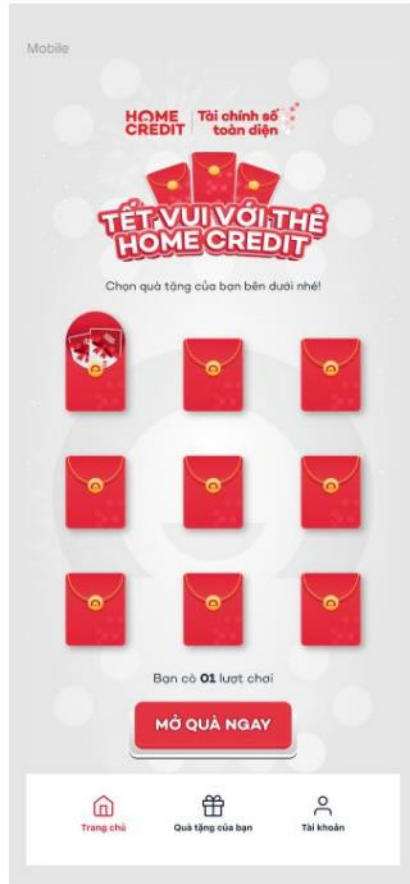
Hình 2: Màn hình chính để mở quà