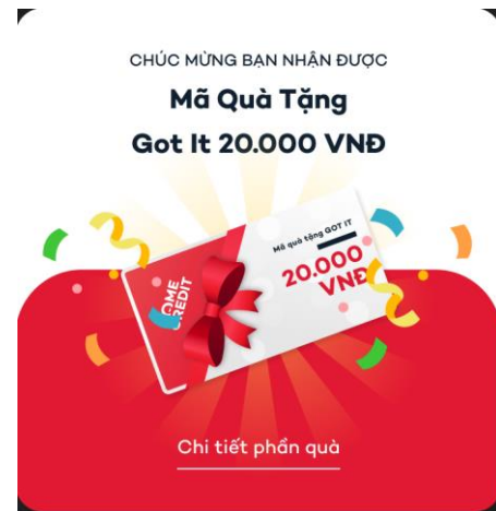
Hình 3: màn hình thông báo

Bước 4: Chủ Thẻ Hợp Lệ có thể kiểm tra danh mục Quà Tặng nhận được tại mục “Quà tặng của bạn”