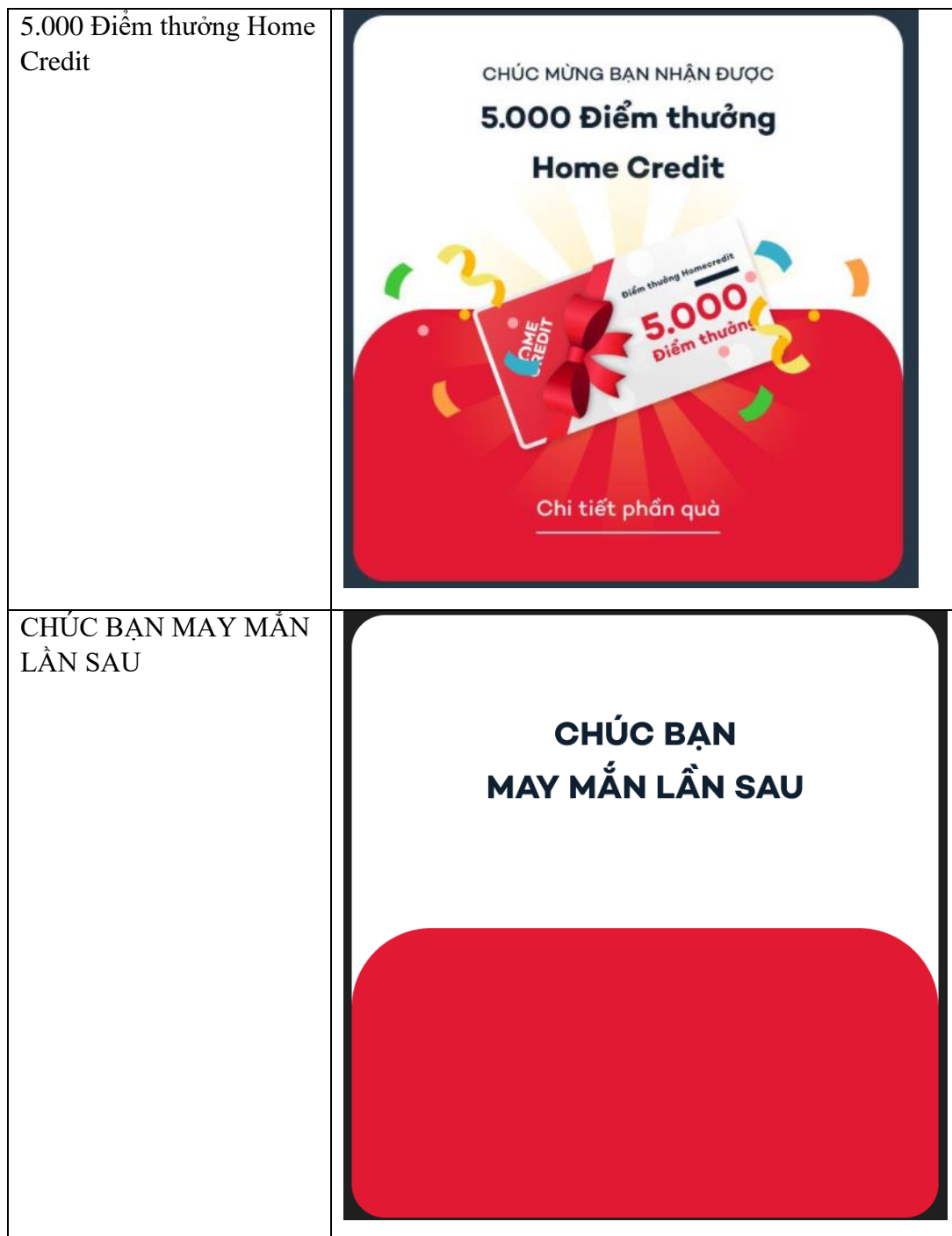
Hình 5: màn hình thông báo